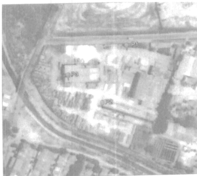
Figura 2. Ubicación geográfica e las estaciones de monitoreo.

La ubicación geográfica de las estaciones de monitoreo se muestra en la Figura 2.